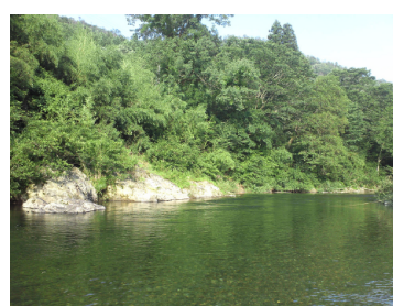
美しい清流、由良川が待っています。