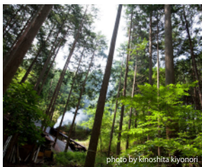
トレッキングルート(目的地の炭窯)